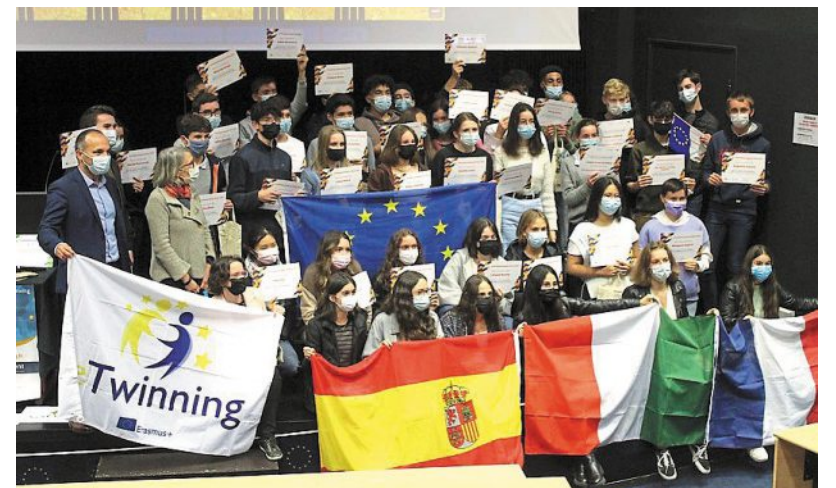
Une quarantaine de lycéens sont venus recevoir le prix qui leur était dû.

Saint-Gabriel : des élèves lauréats ETwinning