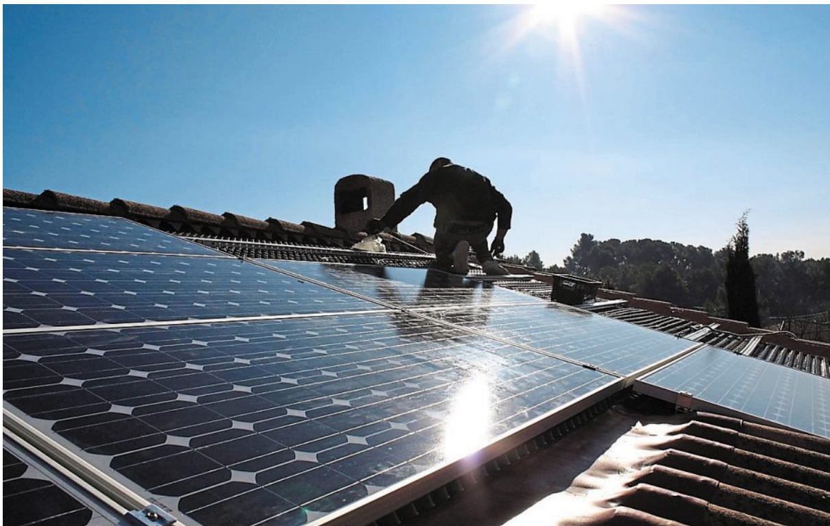
Les panneaux solaires sur les toits ou sur les parkings, une piste pour produire de l'énergie renouvelable au Rheu.

Cette convention précise la volonté de « massifier le développement des projets photovoltaïques en faisant participer les acteurs économiques et de leur proposer une solution de développement du photovoltaïque en toiture, sur parking ou au sol.