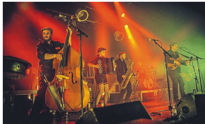
Le groupe La Gâpette animera la soirée du 14-Juillet.

De la musette très électrique pour la Fête nationale