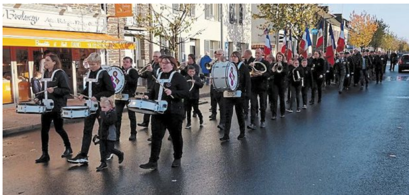
La fanfare plélanaise et la brigade des sapeurs-pompiers mèneront le défilé entre la mairie et la place de l'Église.

Un défilé en fanfare, ouvert à tous, pour le 14-Juillet