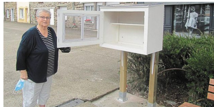
Encore vides, les boîtes à livres attendent les premiers lecteurs pour être fonctionnelles.

Deux boîtes à livres à disposition des habitants