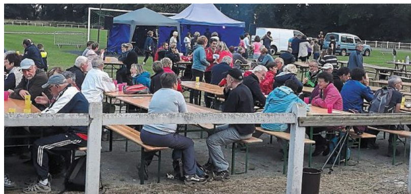
Les randonneurs attablés devant l'orchestre, à la fin de leur marche.

Beau succès pour la randonnée du club de football