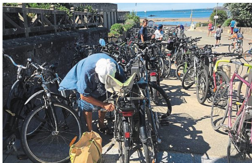
Avec une augmentation de la pratique du vélo, les cyclistes veulent se faire entendre des candidats pour obtenir des aménagements.